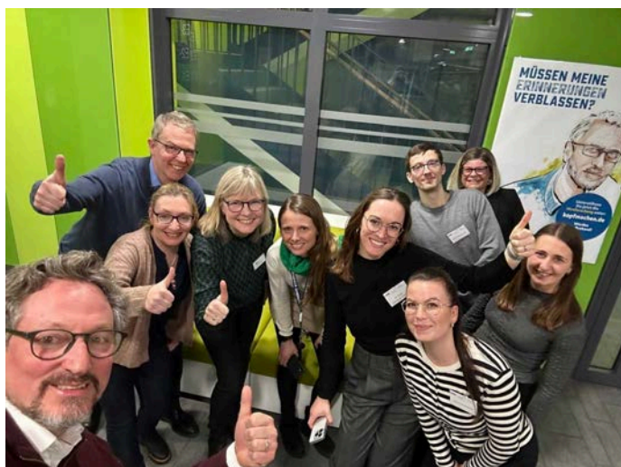
Selfie mit Herrn Dr. Hirschhausen und dem Z03-Team