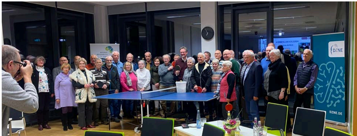
Alle Teilnehmer des “Super-Ager Cafés”

Im Herbst wird dann das Ergebnis auch im TV zu sehen sein. Wir bedanken uns bei allen Beteiligten für den gelungenen Tag und freuen uns auf die Ausstrahlung!